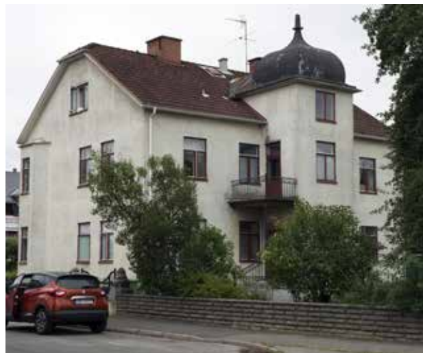
Till vänster: Ett av tidigare Skara Bostads Aktiebolags tre hus i kvarteret Gräshoppa, med baksidan in mot det gemytliga och närmast lantliga Marumsparken. Till höger: Det säregna Vinkölgatan 2A med kupolliknande plåtklätt tak över trapphusutbyggnaden.

Längst i söder finns kvarteret Gräshoppa som bildar ett eget stadsrum omkring Marumsparken. En liten kil i övergången mellan S:t Anne äng och Oxbacken. Tomterna har styckats av omkring en liten park, som också fungerar som infart till byggnadernas baksidor. De olika gårdshusen i såväl trä som tegel ger en sär egen variation och förtjänar att lyftas fram. Ett och annat plank skymmer tyvärr sikten och skapar barriärer inom kvarteret.