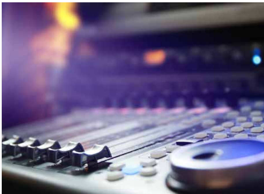
MUSIKHJÄLPEN 15 december

Gå in på evenemangskalendern på skara.se och se vad som redan är på gång. Då kan du undvika olyckliga krockar. Kontakta sedan turistbyrån för att få med ditt evenemang i våra kanaler.