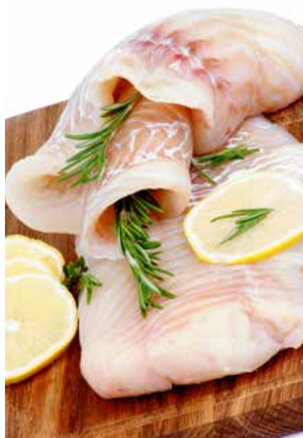
TEXT: SKARA KOMMUN.

Smörj eller skölj en form med vatten Lägg i den råa fisken Krydda med salt och peppar Blanda mezeyoghurt/creme fraiche, grädde, mjölk, fiskbuljong, citronsajt och skal samt lite maizena (blir lätt tunt utan maizena) och håll över blandningen över fisken. Grädda i ugn 225 grader cirka 15 minuter.