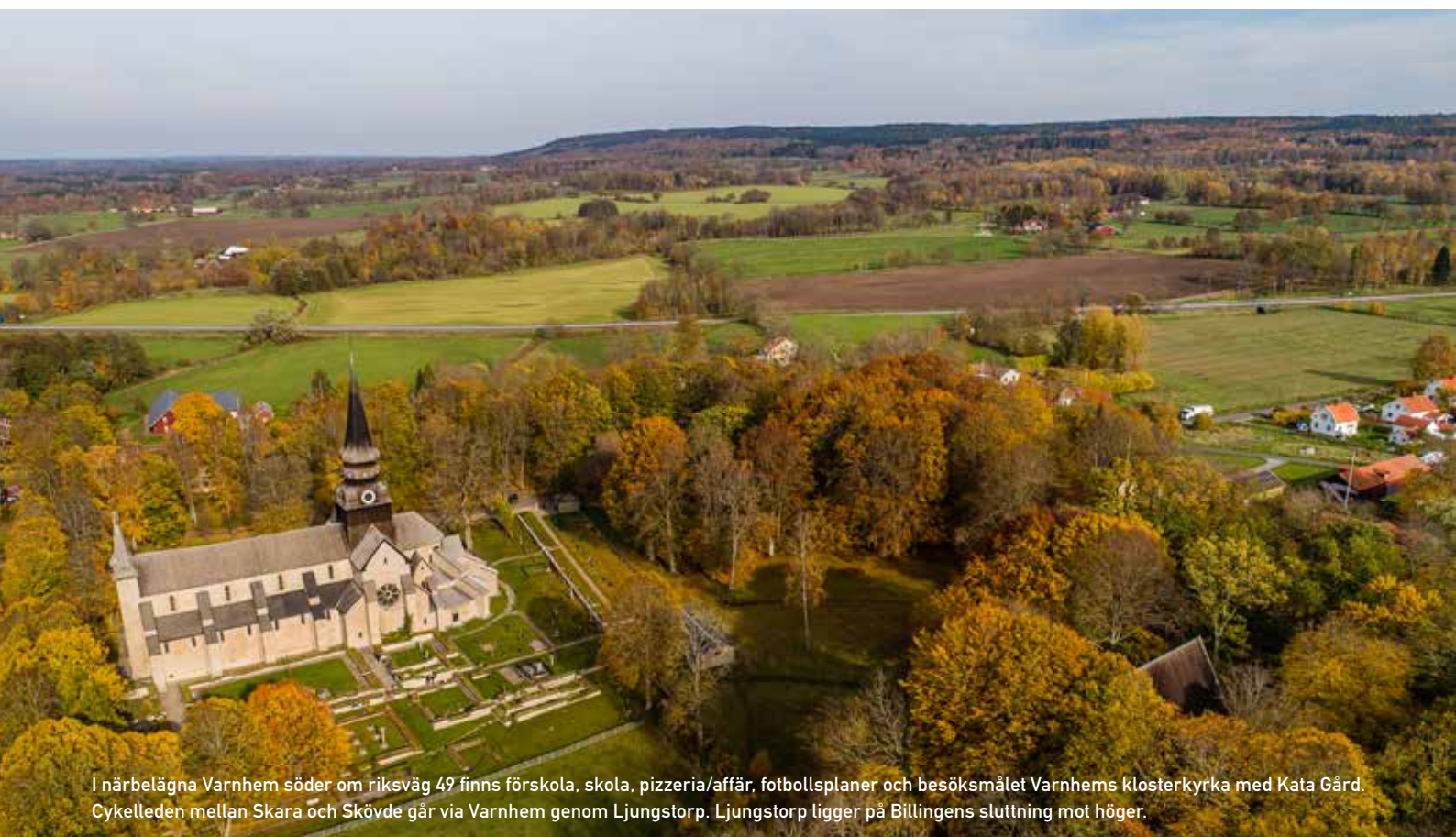
I närbelägna Varnhem söder om riksväg 49 finns förskola, skola, pizzeria/affär, fotbollplaner och besöksmålet Varnhems klosterkyrka med Kata Gärd. Cykelleden mellan Skara och Skövde går via Varnhem genom Ljungstorp. Ljungstorp ligger på Billingens sluttning mot höger.

Skara ligger i Sverigetoppen för bygglovshantering, och vi hoppas att du blir nöjd med den service vi erbjuder när du bestämmer dig för att bygga och bo här – på landet, i staden eller mittemellan. Lycka till med dina planer!