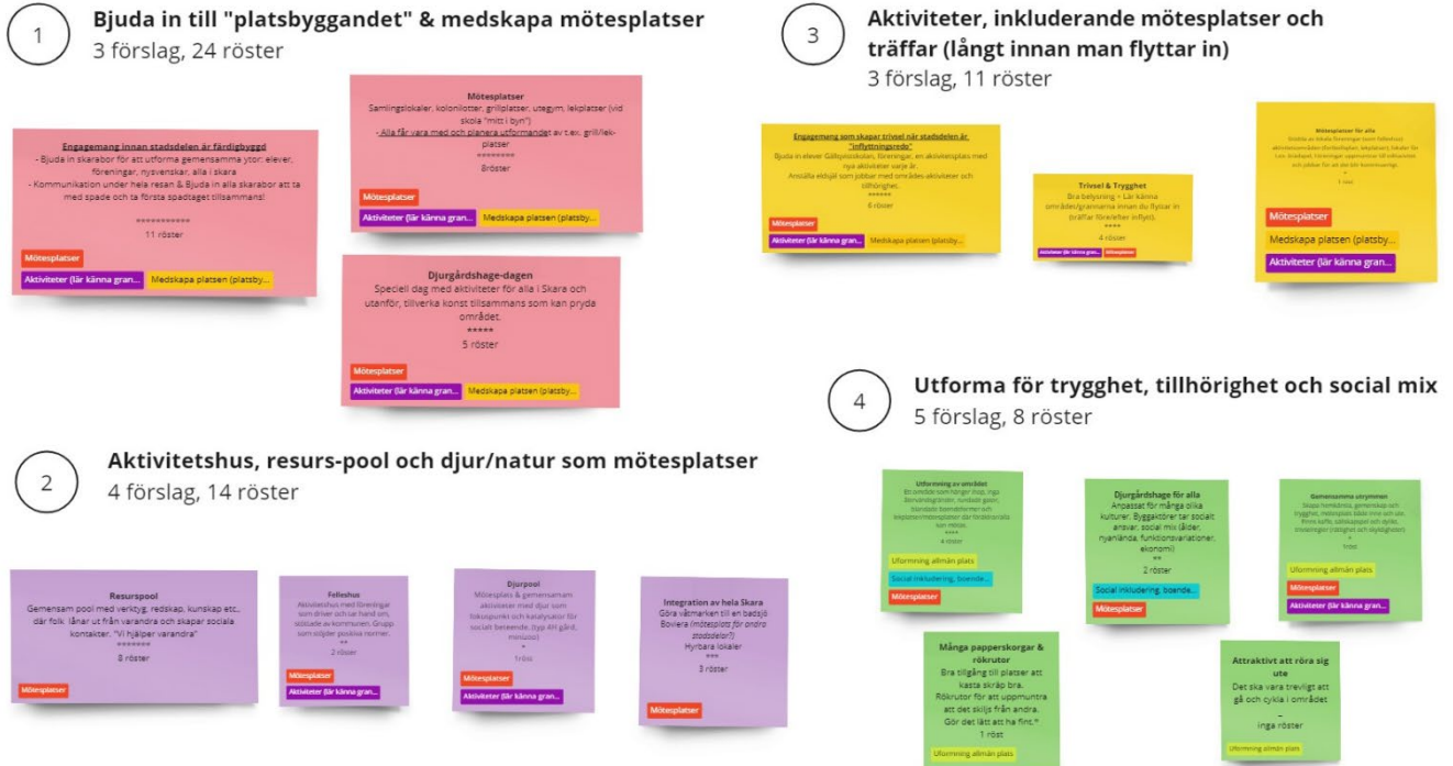
Figur 2 - Samtliga rekommendationer grupperade efter teman. Taggar visar 4-5 övergripande teman som går tvärsöver dessa teman. Färgförklaring taggar: Röd = mötesplatser, gul = medskapa platsen, lila = aktiviteter, blått = social mix, grönt = utformning.