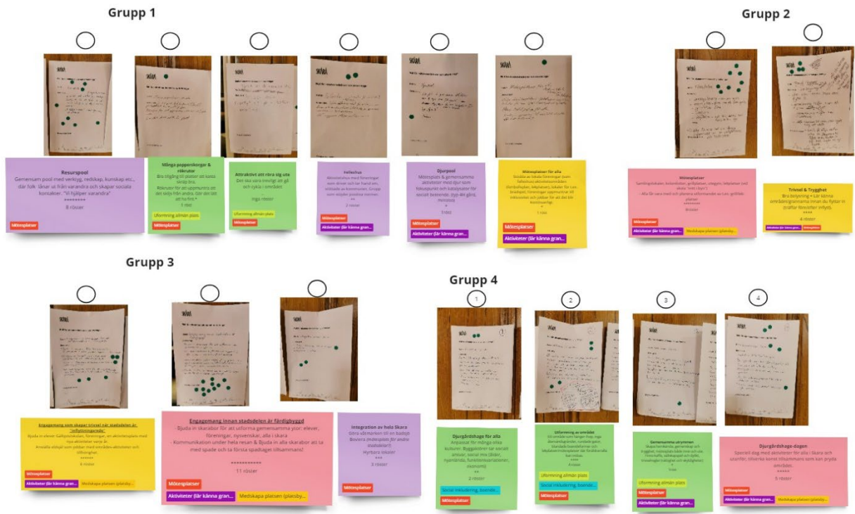
Figur 1 - En bild som visar samtliga rekommendationer samt dess huvudbudskap och teman (färg på post it lapp) - precis som på ovanstående bild så är de färgade taggar större teman.