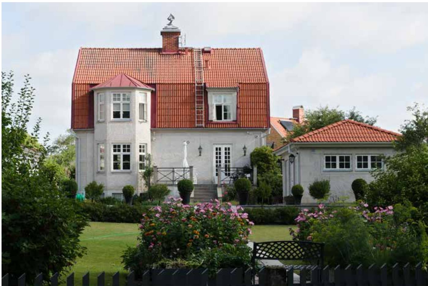
Ovan: Döbelnsgatan 13 från 1928 är ett av de välbevarade husen på den södra sidan av Döbelnsgatan. Den stora trädgården breder ut sig ner mot Afsen.

Den tredje delen av stadsdelen är invid och öster om Härlundagatan. Här är bebyggelsen varierad med bland annat kvartersbebyggelse som Skara bryggeri och flerbostadshus som det mycket välbevarade Folkungagatan 11. Mitt emot 11:an finns Folkungagatan 12 som trots vissa ombyggnader är viktig för områdets karaktär. Härlundagatan 18 är ett annat speciellt inslag i den här delen av stadsdelen. Det är en liten smal stuga med en mycket dekorativ entré från Härlundagatan som ger ett