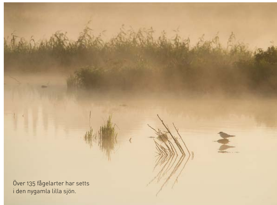
Över 135 fågelarter har setts i den nygamla lilla sjön.